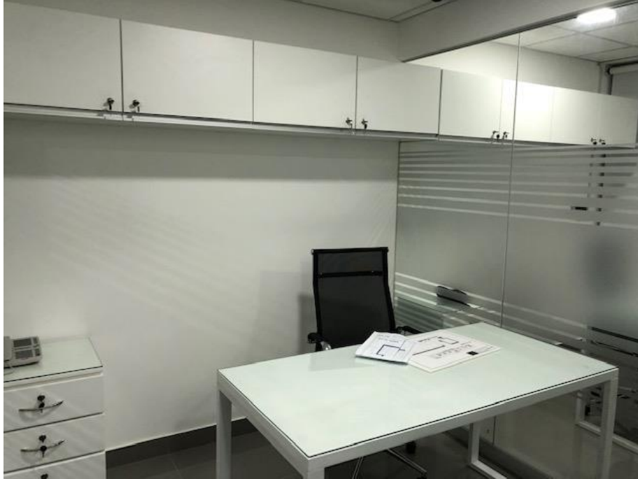
OFICINA N° 2